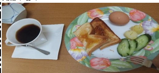
7月2日(木)のモーニングメニューです。

皆さんはきちんと朝食を食べていますか？朝食を食べていない人は年々増えているようです。朝食を食べないと体温が上がらず、エネルギー不足でボーっとしたりします。また、食べない習慣が生活習慣病のリスクを高めることもわかっています。Caféルリエで朝食を食べて、元気に過ごしませんか(^o^)